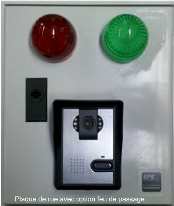
Plaque de rue avec option feu de passage